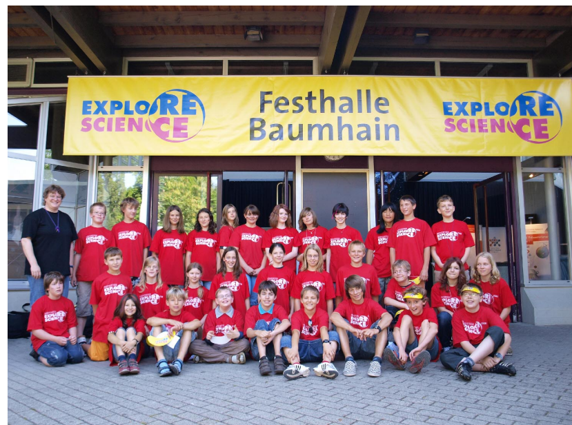
Die Klasse 6c des Neckarelzer Auguste Pattberg Gymnasiums.