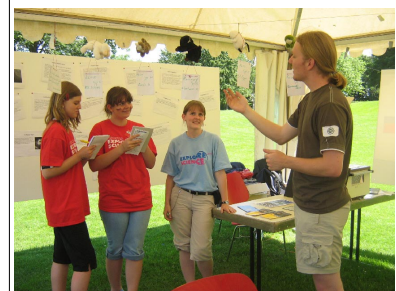
Reporter bei der Arbeit.