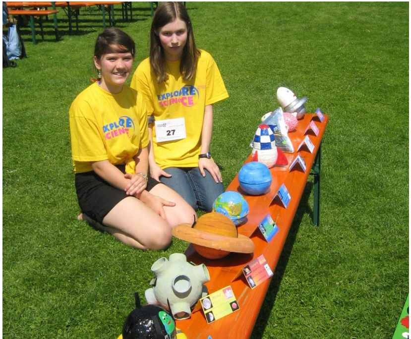
Verschiedenste Projektformen für die sichere Landung.

Wir stellen Euch den Wettbewerb "Mondlandung" vor. Dabei muss ein Ei drei Meter hoch und zehn Meter weit geschleudert werden. Es muss danach auf einem Feld mit einer Größe von einem Quadratmeter landen, dort liegen bleiben und es darf nicht kaputt gehen. Die Teilnehmer benutzten dazu überwiegend katapultartige Wurfmaschinen, bei denen Gummibänder gespannt und dann losgelassen wurden, wodurch das Geschoss fortgeschleudert wurde. Daneben gab es noch Ausnahmen wie Armbrüste, Schleudern und ein Druckluftrohr: Bei diesem bläst ein Kompressor Luft in ein Abflussrohr, in welches vorher das Projektil gesteckt wurde. Durch zwei Hebel wird die Luft plötzlich freigesetzt und befördert das Ei nach draußen. Die Proble-